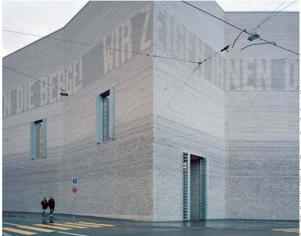
Foto: Filip Dujardin («Westkaai Towers»); Rory Gardiner («Kunstmuseum»)