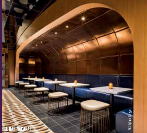
LE BAR NACARAT