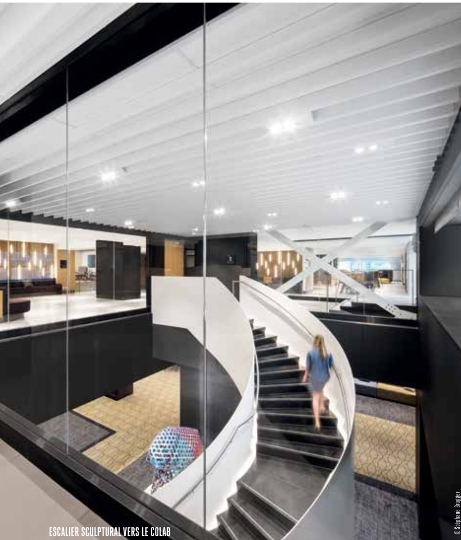
ESCALIER SCULPTURAL VERS LE COLAB