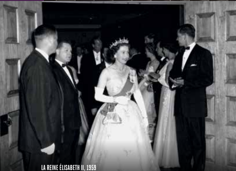
LA REINE ÉLISABETH II, 1959