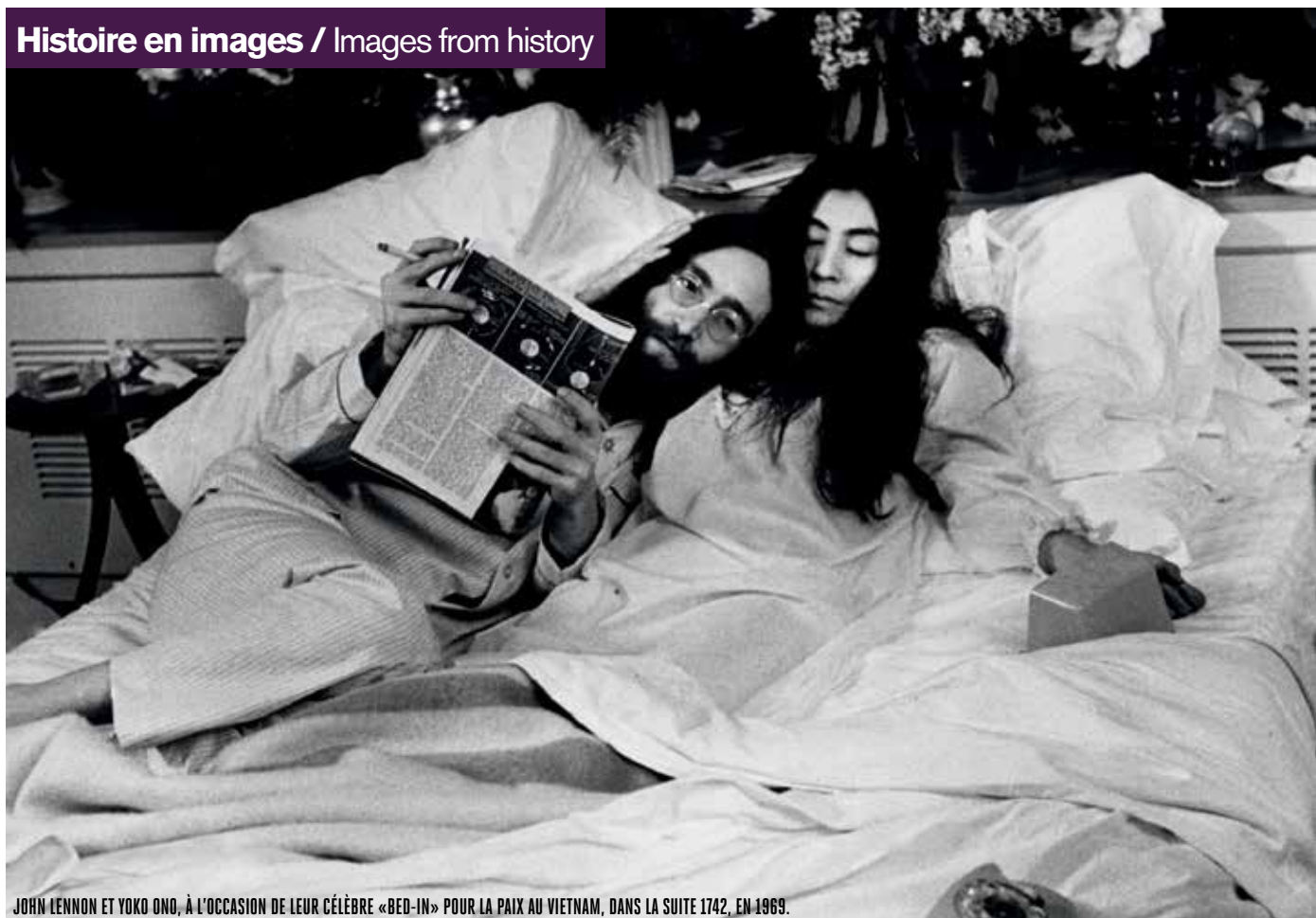
JOHN LENNON ET YOKO ONO, À L'OCCASION DE LEUR CÉLÈBRE «BED-IN» POUR LA PAIX AU VIETNAM, DANS LA SUITE 1742, EN 1969.