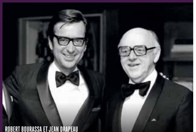
ROBERT BOURASSA ET JEAN DRAPEAU