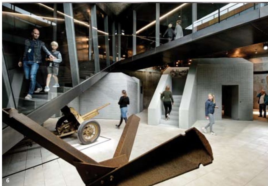
1 a 3. Frente a la mole del búnker, el museo apenas se sugiere por los cortes abiertos en las dunas, que confluyen en un espacio central desde el que se accede a los espacios subterráneos. 4 a 6. Literalmente talladas en la arena, las galerías acogen diferentes exposiciones relacionadas con la región de Jutlandia, desde las historias humanas a la sombra del búnker, a la riqueza que proporciona el mar o los yacimientos de ámbar.

túnel, el museo surge discretamente de la intersección de una serie de precisos cortes realizados en las dunas. “La arquitectura del Tirpitz es la antítesis del búnker, explica Bjarke Ingels. El objeto hermético, pesado, es contrarrestado por la ligereza y la apertura del nuevo museo. Las galerías están integradas en las dunas como un oasis abierto en la arena. Los caminos a su alrededor descienden para encontrarse en un claro central, trayendo la luz del día y el aire al corazón del complejo. El búnker sigue siendo el único hito de una herencia oscura no tan lejana que, tras una estrecha inspección, marca la entrada a un nuevo lugar de encuentro cultural”. El edificio se construye a partir de cuatro materiales principales, también habituales en su entorno: hormigón, acero, vidrio y