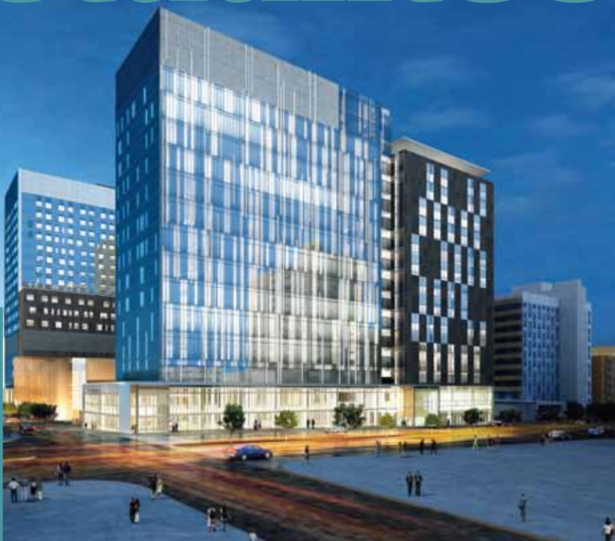
© CANNONDESIGN + NEUF ARCHITECTES, YANN POUREAU ET KARINE SWARD

Il s'agit du plus grand projet de construction en milieu hospitalier en Amérique du Nord et, à l'heure actuelle, l'un des plus importants au monde. Le complexe regroupera sous un même toit trois anciens hôpitaux sur une surface de 275 000 m 2 et comptera 772 chambres privées, 39 salles d'opération et plus de 400 cliniques et salles d'examen. Il sera réparti sur 27 étages (22 hors sol et 5 en sous-sol). Le nouveau campus du CHUM comptera 13 œuvres d'art d'envergure, toutes intégrées à l'architecture, constituant ainsi la plus grande concentration d'art public à Montréal depuis l'Expo 67. Le projet a été lauréat d'un prix A+ Award de Architizer à New York, ainsi que d'un prix A' Design Award en Italie. L'hôpital universitaire sera achevé en 2021 et aura coûté 1,5 milliard de francs suisses. ■ [J.L.O.] source: v2com