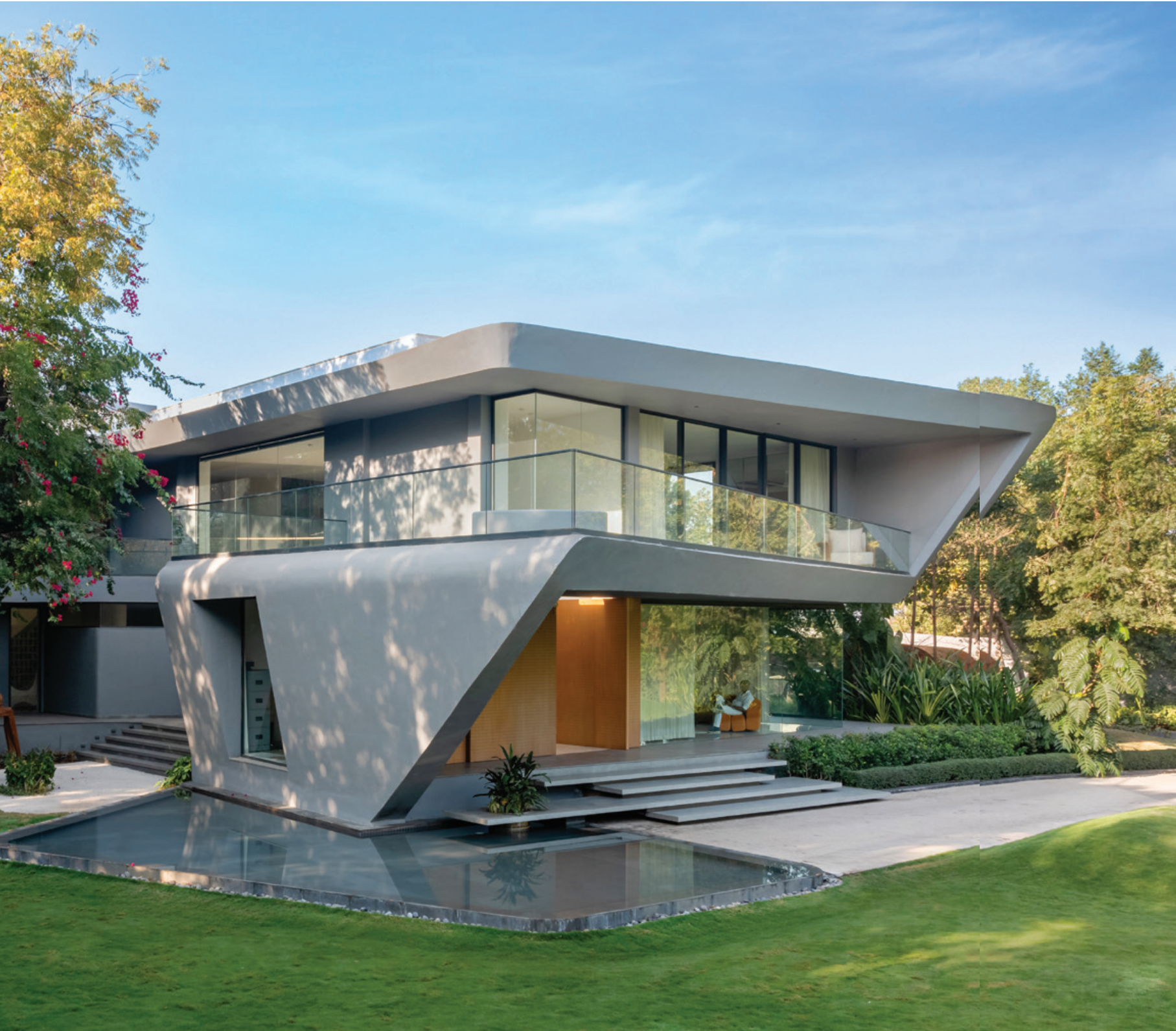
Fraîcheur. Sur le côté nord-est, un bassin peu profond assure un refroidissement passif des espaces. Ouverture. Des ondulations architecturales offrent des percées sur le terrain de 3 311 m 2 , situé à Gandhinagar, en Inde.