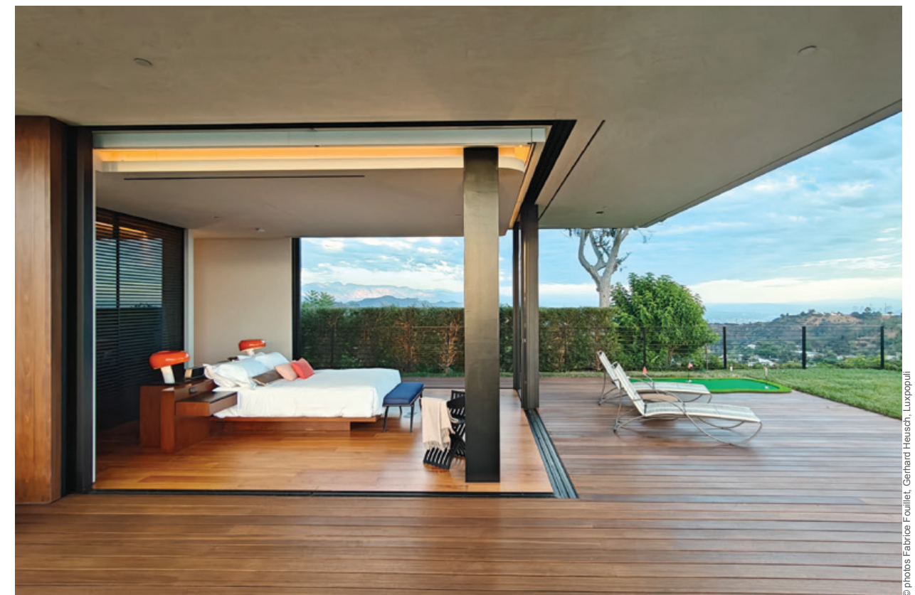
Spectaculaire. Sol et murs effet marbre, meuble en bois rouge et vastes ouvertures composent une salle de bains grandiose. Prolongation. Ouverte largement sur trois côtés, la chambre donne l'impression à ses occupants de vivre dehors.