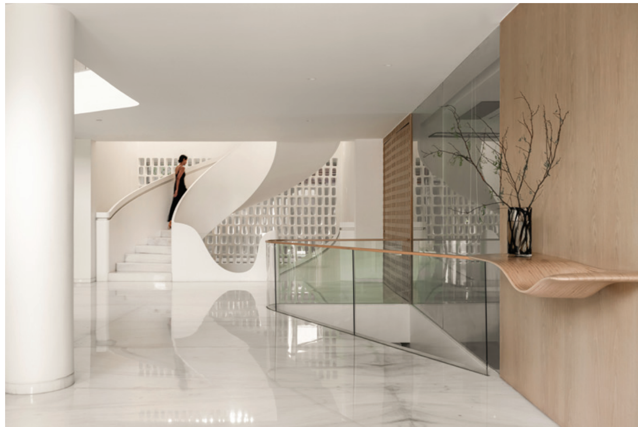
Sérénité. Le minimalisme intérieur met en valeur le marbre blanc et le mobilier en bois, tissant une atmosphère apaisante. Majesté. L'escalier en spirale structure le cœur de la villa et relie tous les niveaux avec une fluidité presque artistique.